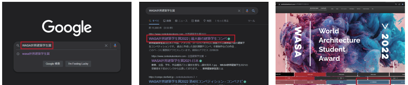
【STEP1】 搜索 “WASA 世界建築學生獎”